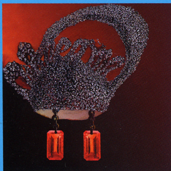
「Welcome'S Diams Island」

Welcome / Ups and Downs / The Wandering Rabbit