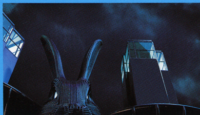
「The Wandering Rabbit」