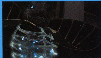
「The Wandering Rabbit 2」

頭の上には帽子に見える「Welcome'S Diams Island」を載せ、 水の中で眠る怪物のようなネズミの話や、ビルのような建物群をどこにでもあるような砂漠に運び、 新しい街を作ろうとするウサギの話を3Dアニメーションで展開。音楽は東京で出会った音楽家、 種子田郷（→p.24）とコラボレーションを行った。